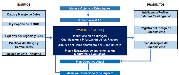
Gráfica 1. Marco conceptual de la gestión de riesgo de cumplimiento tributario